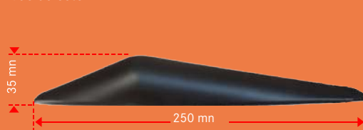
Vue de côté