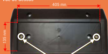
Inserts pour la fixation de la plaque sur le support